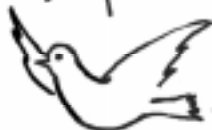
Голубь — птица дневная