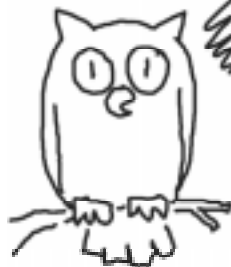
Сова — птица вечерне- ночная