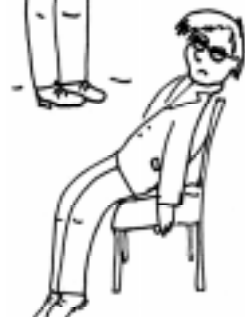
Фаза истощения (дистресс)

В жизни иногда случаются тяжелые, трагичные события, предотвратить которые не в наших силах (тяжелая болезнь или травма, смерть близких людей, пожар, попадание в серьезную автомобильную аварию и т. п.). Естественно, такие ситуации вызывают сильнейший стресс, иногда они на некоторое время буквально «оглушают» человека, лишают его возможности адекватно воспринимать действительность и регулировать свое поведение. Реакция на подобные ситуации обычно проходит несколько стадий: человек сначала может вообще отрицать, что это произошло с ним, потом в какой-то момент испытывает сильнейшую обиду на судьбу («Почему, за что именно со мной?!»), после этого начинает горевать и активно «выплакивать» свою беду, а потом, со временем, его жизнь возвращается к норме. Иногда это занимает